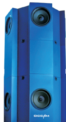
Omni Stereo 全方位ステレオカメラ