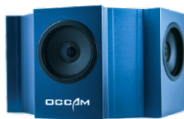
Omni60 小型全方位カメラ