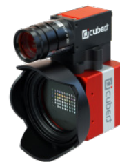
X20P パンシャーブン対応モデル