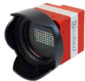
X20 スタンダードモデル